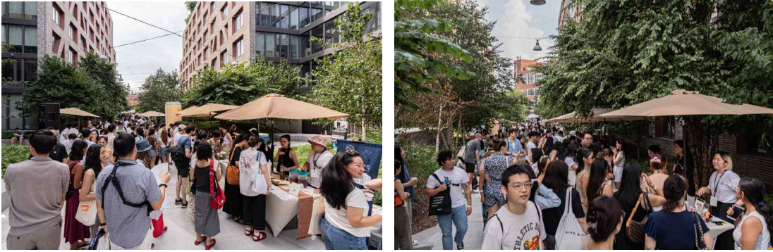
[<마음마켓> 현장]

이날 행사장을 찾은 현지인들은 “한국문화를 배울 수 있는 흥미로운 이벤트가 이어져 시간가는 줄 모르고 즐겼다.” “이렇게 좋은 품질의 제품들을 한자리에서 만날 수 있다니 매우 유익했다.” “한인 인플루언서들과 작가들을 직접 만날 수 있어서 행복했다”는 등의 열띤 반응을 보이며 만족감을 나타냈다.